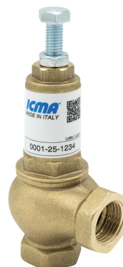
Immagine a solo scopo illustrativo. Le caratteristiche possono variare rispetto al prodotto reale.